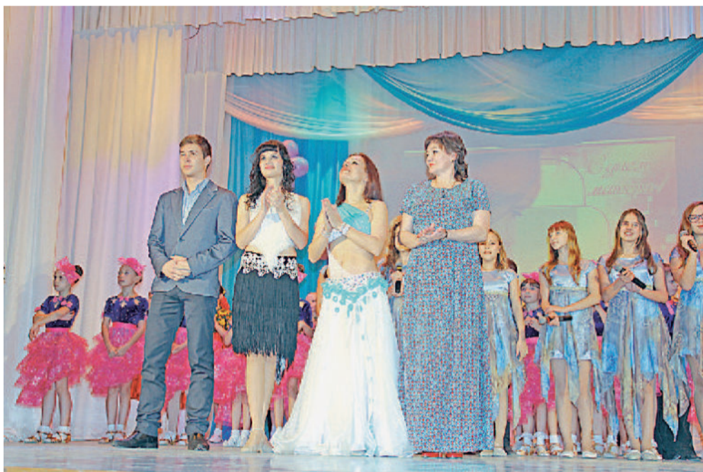
ОНИ БЛЕСНУЛИ ТАЛАНТАМИ! На сцене заводчане!