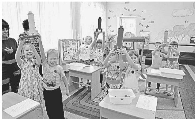
Ракеты устремились ввысь!

В ноябре детским садом № 95 было организовано профориентационное мероприятие. Праздник прошёл в игровом формате детско-родительского квеста «Город машиностроителей».