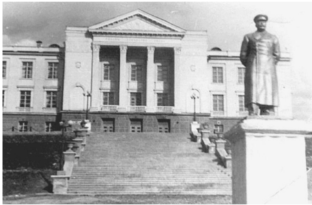
Дворец, 1947 год.