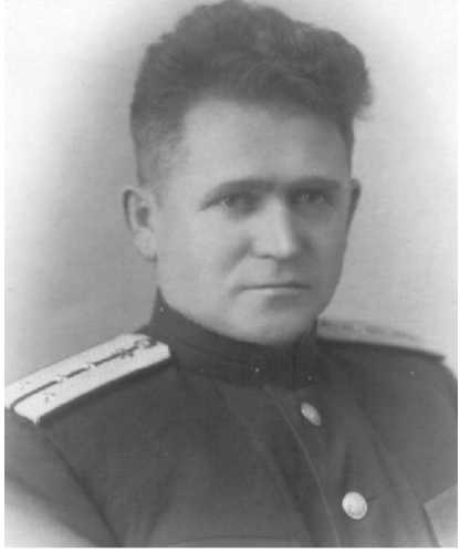
Архитектор Дворца М. В. Братцева (1902–1995 г.)

Сегодня мы открываем юбилейную рубрику, посвященную нашему Дворцу Победы. Первый рассказ о рождении ДК, который в полной мере можно назвать памятником истории и культуры.