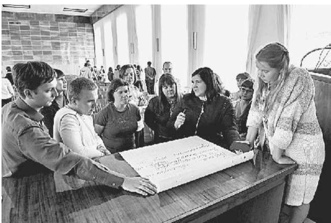
Во время встречи для молодёжи предприятия была организована интерактивная игра.