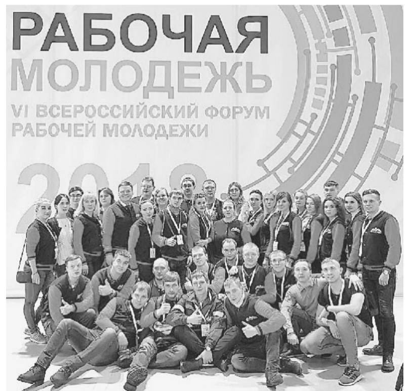
ДЕЛЕГАЦИЯ ЧЕЛЯБИНСКОЙ ОБЛАСТИ.