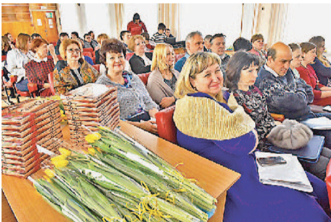
МАРТ. УЛЫБКИ. ВЕСНА!