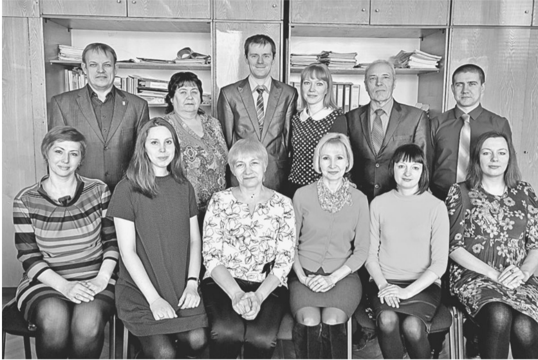
ДРУЖНЫЙ КОЛЛЕКТИВ ОТДЕЛА № 219.