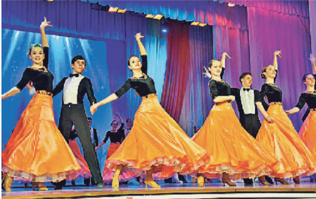
ДЛЯ ВАС, ЗАВОДЧАНКИ!

Этот день всегда отличается особым настроением. 8 Марта — праздник весны, красоты и любви. А ещё замечательный повод, чтобы поздравить прекрасную половину рабочего коллектива с праздником. Ведь женщины, даже если они просто коллеги по работе, приносят в жизнь любого мужчины радость, смех и ощущение нужности.