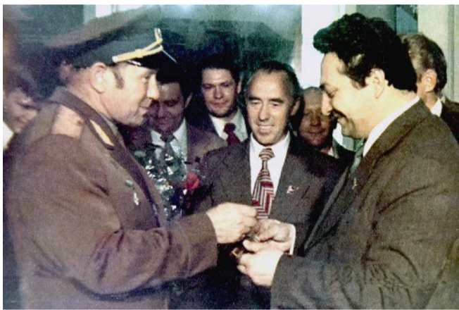
Директор завода В. Х. Догужиев приветствует космонавта на златоустовской земле. 1978 г.

«Внимание! Человек вышел в космическое пространство!» Именно эти слова вошли в мировую историю. Выход в открытый космос Алексей Архипович совершил 18 марта 1965 года, а первым, кто передал об этом сообщение, был командир корабля «Восход-2» Павел Беляев. Алексей Леонов покинул космический корабль через 1 час 35 минут после старта (в начале 2-го витка). Он находился в условиях космического пространства 23 минуты 41 секунду, а вне шлюза в открытом космосе — 12 минут и 9 секунд. В это время он удалялся от корабля на расстояние до 5,35 метра. Во время выхода в космос произошла нештатная ситуация. Выполняя программу первого выхода, Алексей Архипович Леонов испытал трудности с возвращением на корабль, поскольку раздувшийся скафандр не проходил через воздушный шлюз «Восхода». Только срамливание давления кислорода в скафандре и героические усилия Алексея Леонова позволили тогда благополучно завершить полёт.