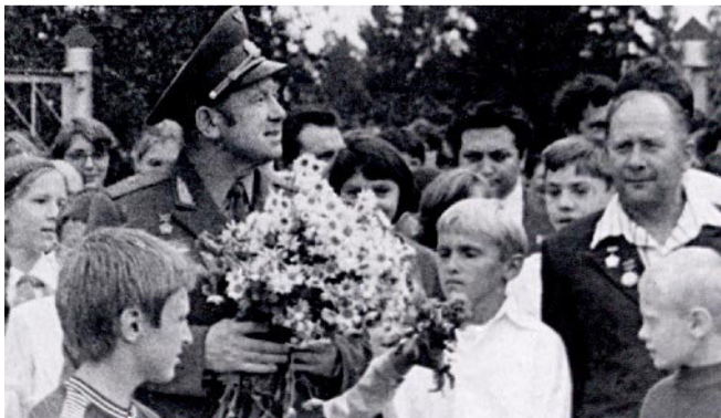
А. А. Леонов в пионерском лагере «Орлёнок». 1978 г.

С Алексеем Архиповичем ушла целая эпоха. Лучшей памятью о нём будут новые достижения отечественной космонавтики, которой он посвятил свою яркую героическую жизнь. Руководство и коллектив Госкорпорации выразили глубокое соболезнование родственникам и близким Алексея Архиповича. В их адрес направлена телеграмма с соболезнованиями от имени главы Роскосмоса Дмитрия Рогозина.